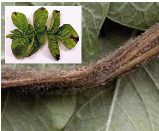
Foto 10. Las lesiones de pudrición gris en hojas son café, húmedas en su inicio, delimitada por las venas. Bajo condiciones de humedad se observa un esporulación gris del hongo B. cinerea en los tejidos afectados.

Los síntomas sobre las hojas y tallos de la planta son los más similares al tizón tardío. Sobre las hojas se