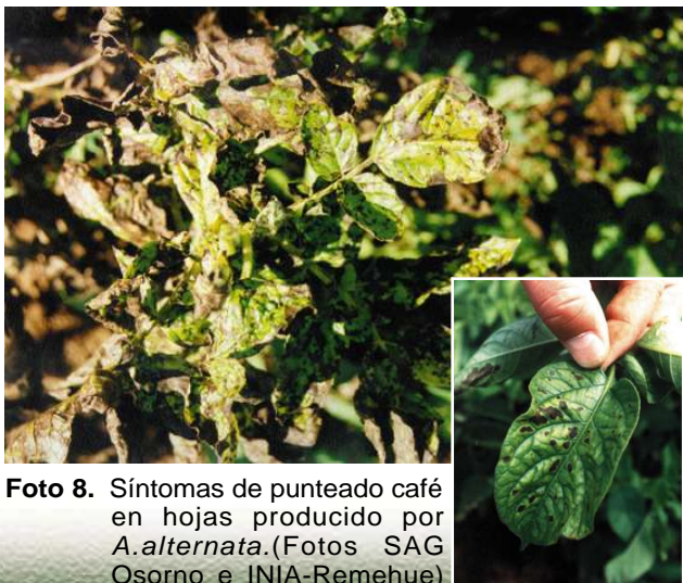
Foto 8. Síntomas de punteado café en hojas producido por A.alternata .

Existe otra especie patógena del hongo Alternaria que puede producir síntomas muy similares al tizón temprano, esta corresponde a A.alternata conocida como punteado café. Aunque la lesión producida por este hongo en las hojas comienza como pequeños puntos necróticos circulares, café oscuros, de aproximadamente 1 cm. de diámetro (Foto 8),