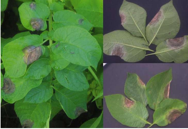
Foto 2. El Tizón tardío forma zonas café atizonadas, comenzando principalmente en las hojas basales de las plantas. Si las condiciones ambientales se tornan secas, las lesiones de tizón detienen su crecimiento y se forma un alo amarillo alrededor.