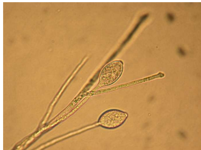
Foto 1. Foto microscópica del hongo Phytophthora infestans .

El tizón tardío es causado por el hongo Phytophthora infestans (Foto 1). Es la enfermedad más seria que afecta el cultivo de la papa en el mundo. Esta enfermedad se dispersa rápidamente y puede abarcar grandes superficies cuando las condiciones climáticas son favorables.