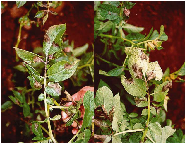
Foto 3. En condiciones de alta humedad, se puede observar la esporulación blanquecina alrededor de la lesión de tizón tardío en el envés de las hojas afectadas.

El tizón tardío afecta hojas, tallos y tubérculos. Los primeros síntomas aparecen en las hojas inferiores, generalmente en los bordes, como pequeñas manchas acuosas de color verde oscuro. Bajo condiciones de alta humedad, estas lesiones se expanden rápidamente formando zonas café atizonadas irregulares. Un borde amarillo pálido alrededor de la lesión separa el tejido sano del enfermo. En condiciones de alta humedad o temprano en la mañana, es posible distinguir el micelio del hongo como un crecimiento aterciopelado de color blanco en el envés de las hojas inferiores (Foto 2 y 3). Si las condiciones de alta humedad persisten, todo el follaje se afecta, colapsa y muere. En cambio, si a la infección le siguen condiciones secas, la enfermedad se detiene y permanece latente hasta que las condiciones óptimas de alta humedad se repitan. En los tallos se forman lesiones de color café púrpura ya sea por