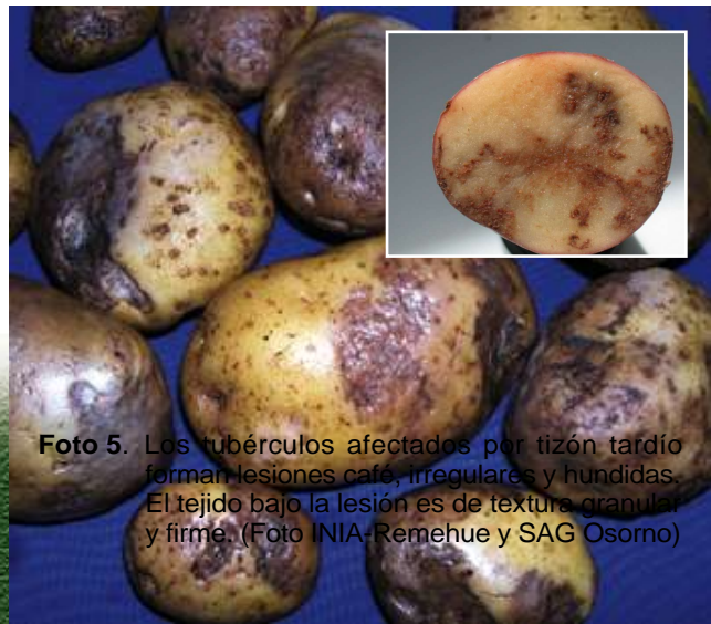
Foto 5. Los tubérculos afectados por tizón tardío forman lesiones café, irregulares y hundidas. El tejido bajo la lesión es de textura granular y firme.

infección directa o por extensión de la lesión de los pecíolos de las hojas (Foto 4). Los tallos afectados se tornan frágiles y quebradizos. Los tubérculos enfermos forman lesiones externas de color café púrpuras de forma irregular y hundidas. Al cortar el tubérculo, el tejido inmediatamente bajo la lesión es de color café cobrizo, de textura granular y firme (Foto 5). En Chile este hongo solamente sobrevive en tejido vivo (tubérculos, plantas voluntarias y otros hospederos susceptibles). En Europa y México, debido a la presencia de los grupos de apareamiento A1 y A2, los cuales al coexistir desarrollan la fase sexual del hongo, puede sobrevivir en el suelo como esporas sexuales resistentes llamadas oosporas. En países donde existe sólo uno de los grupos de apareamiento, la principal fuente de la enfermedad son los tubérculos infectados con el patógeno, a partir de éstos, el micelio crece alcanzando los brotes y finalmente, cuando el micelio alcanza la parte aérea de la planta, produce las estructuras reproductivas asexuales (zoosporangios) que facilitan la diseminación del hongo en el campo. Esta esporulación se produce en condiciones de temperaturas bajas y alta humedad relativa, requiriéndose al menos de 12 hrs bajo estas condiciones para que se produzca la infección y entre 5 a 7 días para desarrollar los primeros síntomas. Los zoosporangios del hongo se