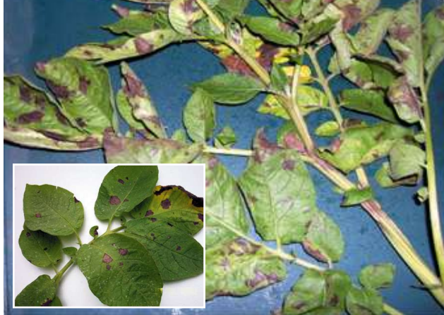
Foto 7. Las lesiones de tizón temprano en hojas son circulares, de color marrón con anillos concéntricos, presentándose primero en las hojas más viejas de la planta, posteriormente las lesiones crecen formando áreas necróticas más grandes, pero delimitadas por las venas de las hojas.

Los primeros síntomas de esta enfermedad en las plantas, se presentan en las hojas basales más viejas, como manchas circulares de color marrón oscuro con anillos concéntricos. Las hojas más jóvenes son más resistentes al patógeno y a medida que la planta envejece se desarrollan los síntomas típicos de la enfermedad. Las lesiones presentes en las hojas inferiores de la planta son la fuente de esporulación secundaria que puede desarrollar una infección grave al final de la temporada. Los síntomas varían según las condiciones ambientales y la susceptibilidad del cultivar. La infección foliar se favorece con alta temperatura (25°C) y humedad. La lluvia estimula la enfermedad, pero no es necesaria si hay rocío abundante y frecuente. Bajo estas condiciones las lesiones presentes en las hojas se agrandan de 0,5 a 2,0 cm. de diámetro desarrollando áreas cloróticas a su alrededor. La expansión de estas lesiones está limitada por las venas de las hojas (Foto 7). Bajo condiciones de sequedad, el tejido dañado cae dejando un orificio en la hoja. En los tubérculos infectados se desarrollan inicialmente lesiones de coloración gris púrpura tornándose posteriormente