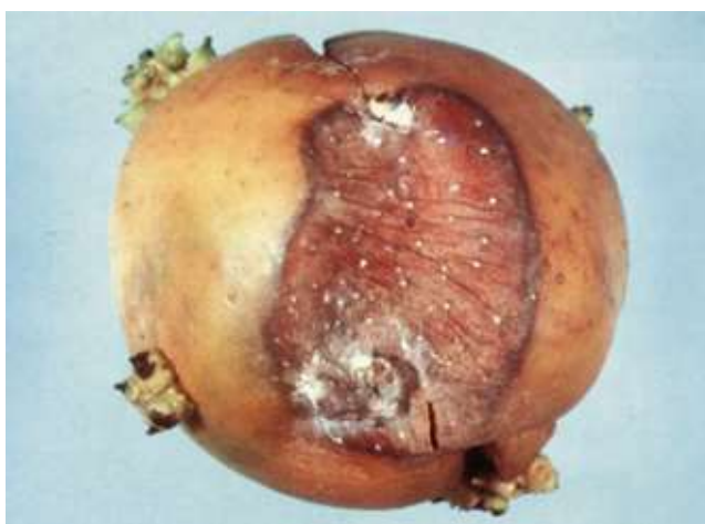
Foto 11. La piel del tubérculo con pudrición gris se presenta arrugada y húmeda en su inicio, tornándose luego en una pudrición seca.

presentan lesiones inicialmente café bronceadas, húmedas, delimitada por las venas (Foto 10), mientras que en los tallos se puede producir una pudrición húmeda, generalmente asociada a una herida. Bajo condiciones de alta humedad se puede observar el color gris de la esporulación del hongo (Foto 10). El tubérculo infectado presenta una piel arrugada, húmeda, suave y negruzca que se torna en una pudrición seca (Foto 11).