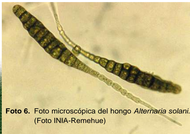
Foto 6. Foto microscópica del hongo Alternaria solani .